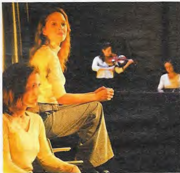
Las cuatro intérpretes

«Guijosa, creador multiforme renovado con cada nueva creación, ha enfocado el recorrido interior de la víctima»